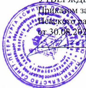
ГРАФИК ПРИЁМА ПИЩИ НА ГРУППАХ